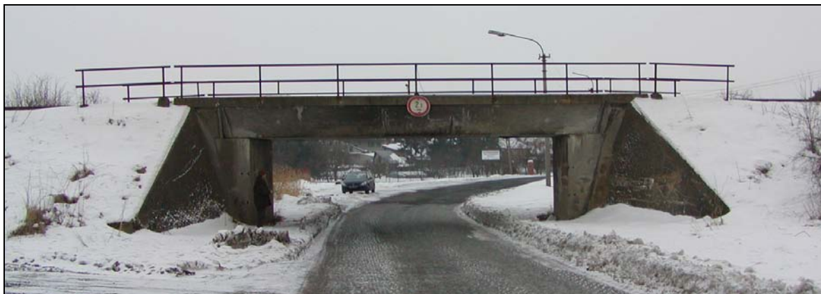
Most v km 69,249