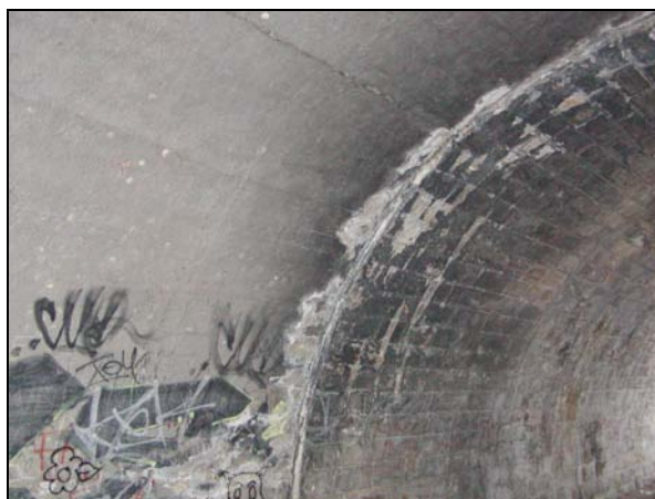
Detail spáry mezi betonovou a kamennou částí