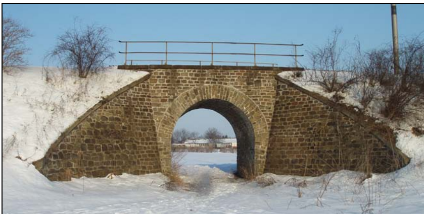
Most v km 63,113 – pohled zprava