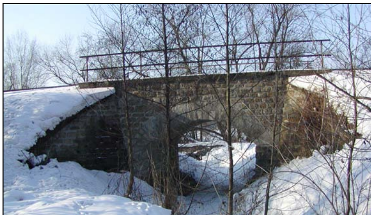
Most v km 77,217