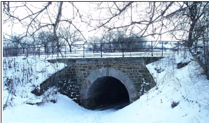
Most v km 40,464 – pohled zleva