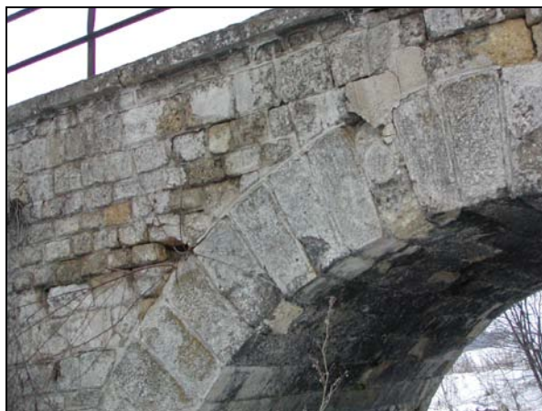
Pohled na porušené zdivo klenby a čelní zdi