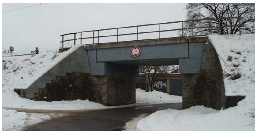
Most v km 47,896 – pohled zleva