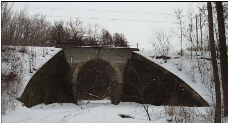
Most v km 51,714 – pohled zprava

M1, M2 – Trať vedena mimo mostní objekt, možné zrušení bez náhrady.