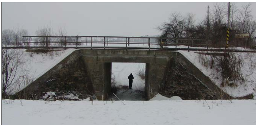
Most v km 66,881

Most o jednom otvoru přes polní cestu. Objekt převádí jednu kolej v širé trati. Nosnou konstrukci tvoří železobetonová deska s kolmým ukončením. Opěry betonové. Křídla svahová, šikmá, betonová. Kolej v přímé. Na mostě je přestavník výhybky.