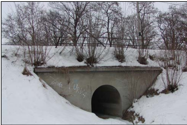
Most v km 65,497

Most o jednom otvoru v širé trati přes potok Žlebůvka ústící pod most zleva. Objekt převádí jednu kolej v obluku o poloměru R655. Nosnou konstrukci tvoří betonová klenba s přesypávkou cca 2,00m. Křídla betonová, rovnoběžná. Kužely jsou odlážděny. Zábradlí je umístěno u koleje v pláni.