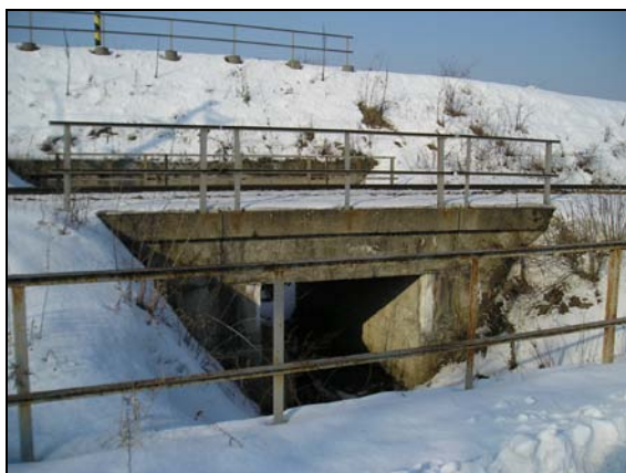
Most v km 87,339

Most o jednom otvoru přes potok Svodnici. Objekt převádí jednu kolej v širé trati. Nosnou konstrukci tvoří železobetonová deska s kolmým ukončením. Spodní stavba kmenná, úložné prahy a parapety betonové. Křídla betonová rovnoběžná. Kolej v oblouku.