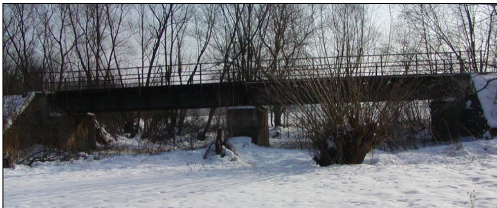
Most v km 75,790