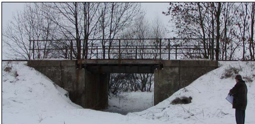
Most v km 74,188