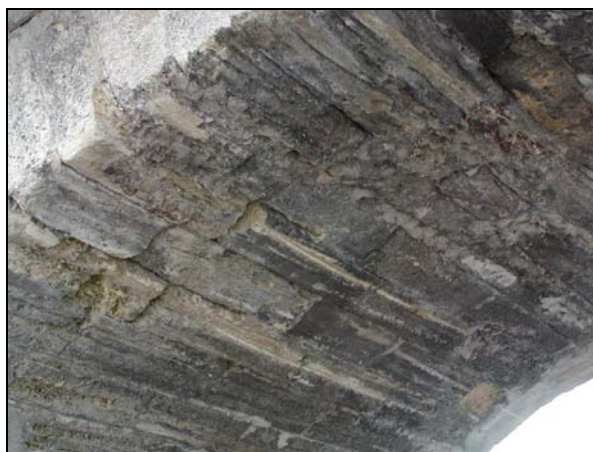
Detail porušeného zdiva klenby

Most o 1 otvoru, pro 1 kolej, přes silnici. Trať v přímé.