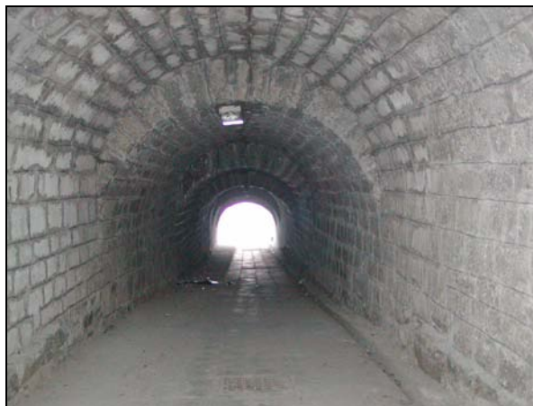
Detail zdiva v podchodu