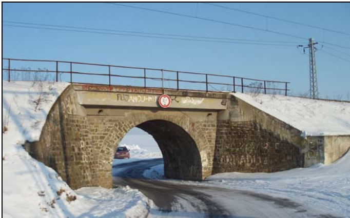
Most v km 61,196 – pohled zprava