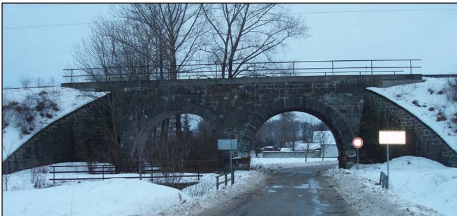
Most v km 58,244 – pohled zleva