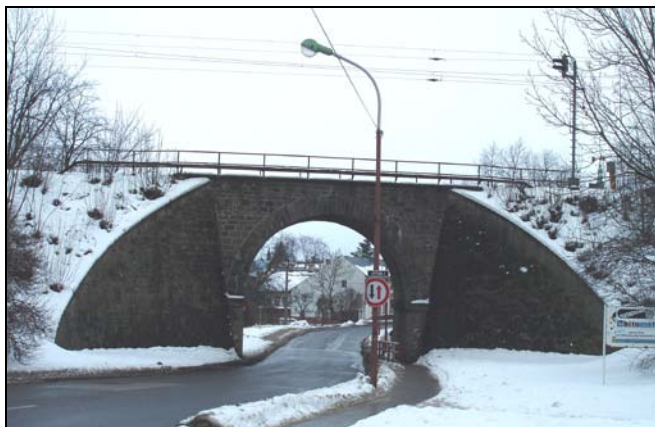
Most v km 47,212 – pohled zleva