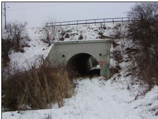
Pohled na most zprava