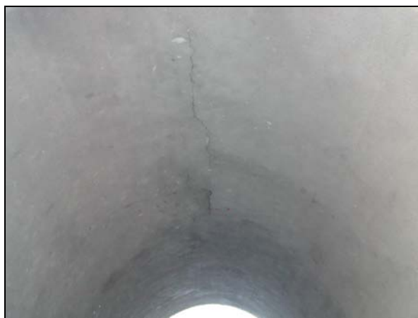
Podélná trhlina ve vrcholu klenby