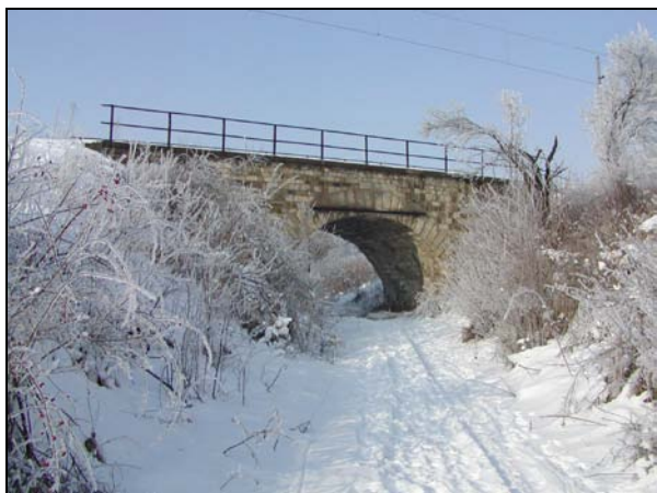
Pohled na most zprava