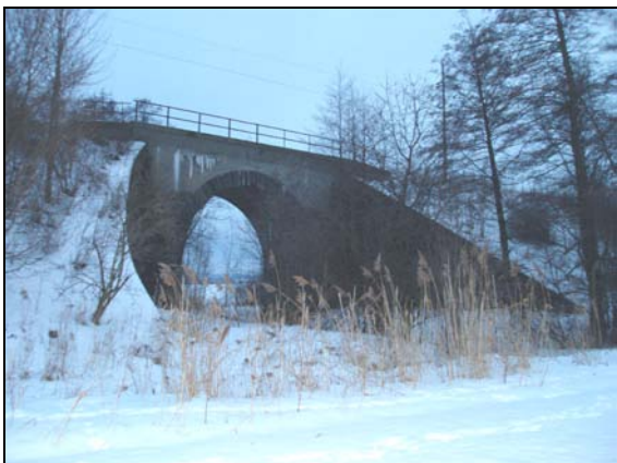
Most v km 57,268 – pohled zleva