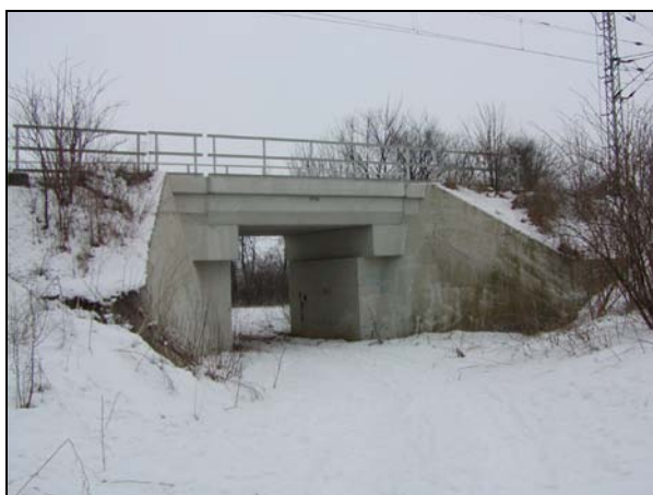
Pohled na most zprava