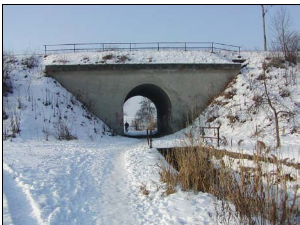
Pohled zprava, pod mostem deskový propustek