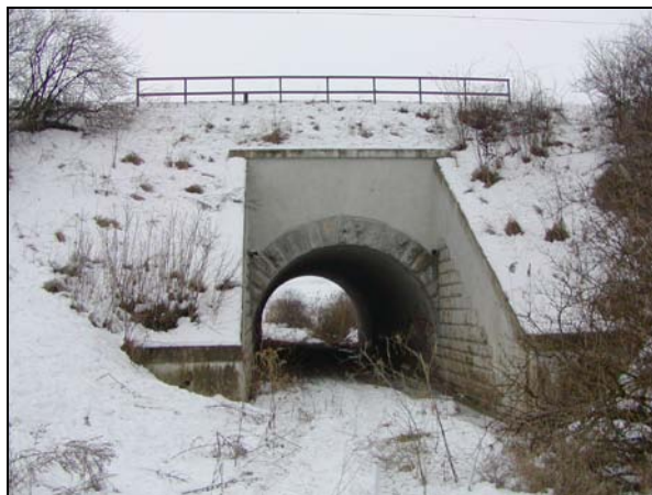
Pohled na most zleva

Most o 1 otvoru, celkem pro 2 koleje, přes polní cestu a svodnicový kanál. Trať v přímé.