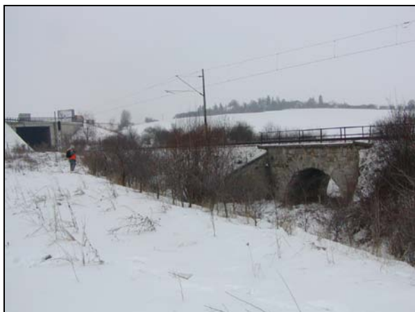
Pohled zprava, vzadu dálniční nadjezd