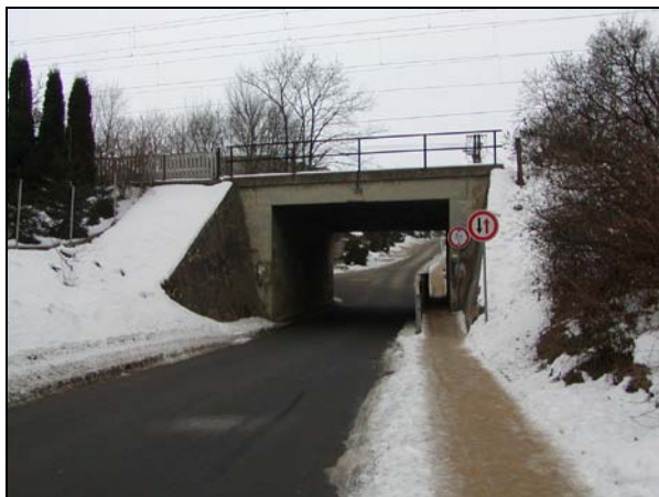
Pohled na most zleva – vlevo žst. Šlapanice