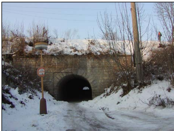
Pohled na podchod v žst. Rousínov zleva trati