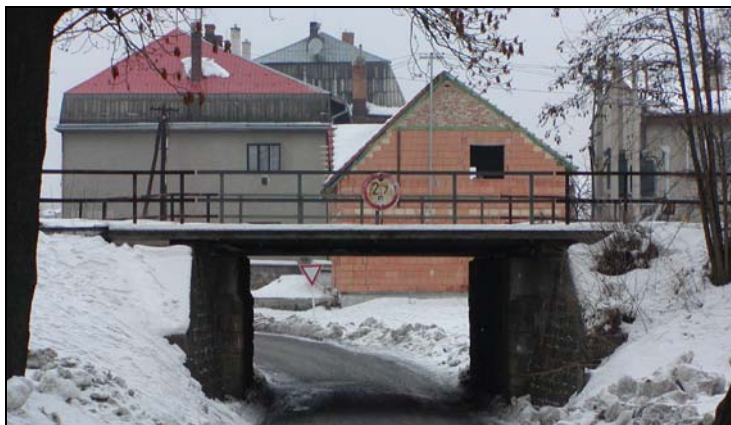
Most v km 73,764