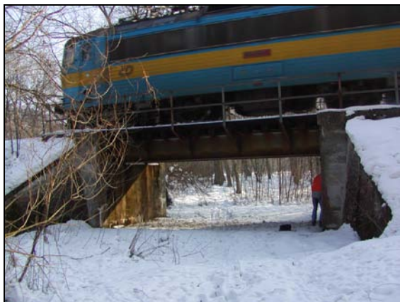
Most v km 75,960