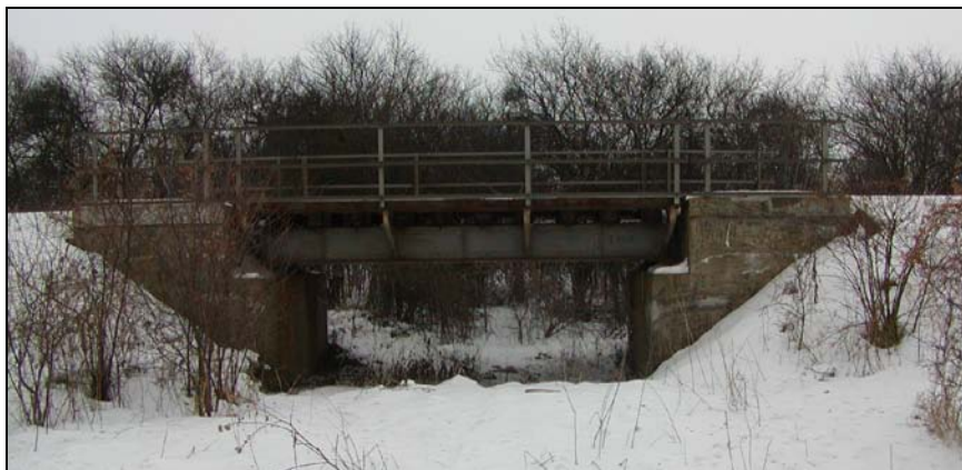
Most v km 74,556