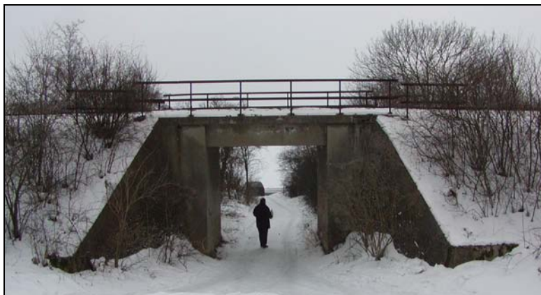
Most v km 64,725