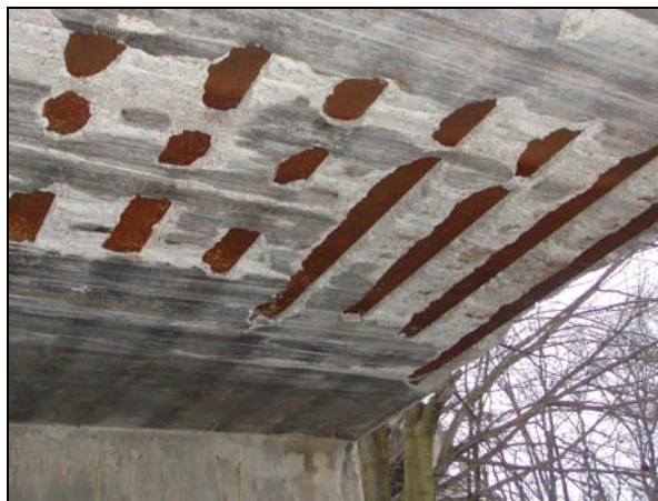
Pohled na poruchy ve spodním líci nosné desky