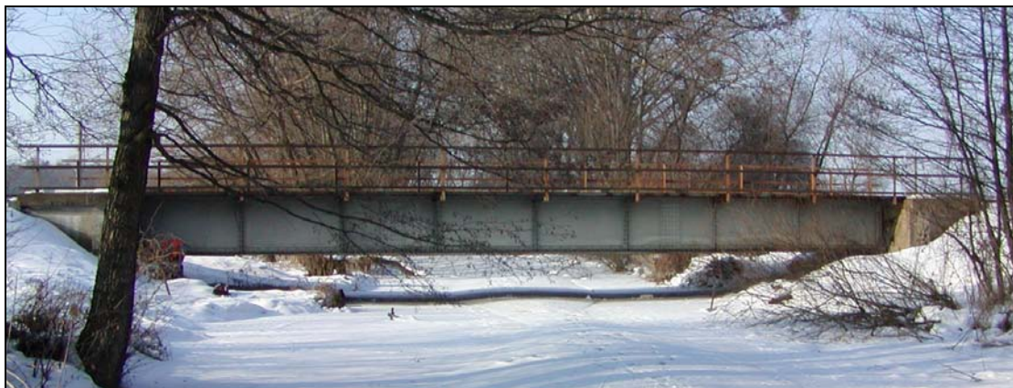
Most v km 77,054