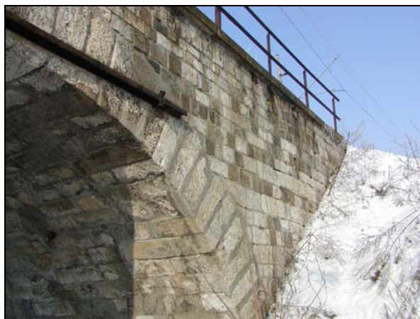
Detailní pohled na přerovskou opěru – sepnutí klenby

Most o 1 otvoru, pro 1 kolej, most přes polní cestu. Trať v oblouku vpravo.