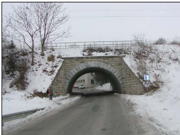
Pohled na most zprava

Most o 1 otvoru, pro 1 kolej, přes místní komunikaci. Trať v oblouku.