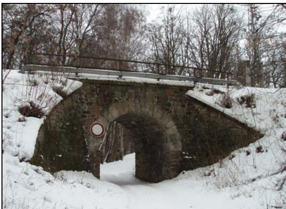
Most v km 49,595 – pohled zprava