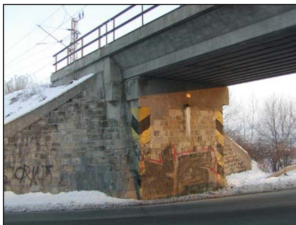
Pohled na přerovskou opěru (ve směru staničení)