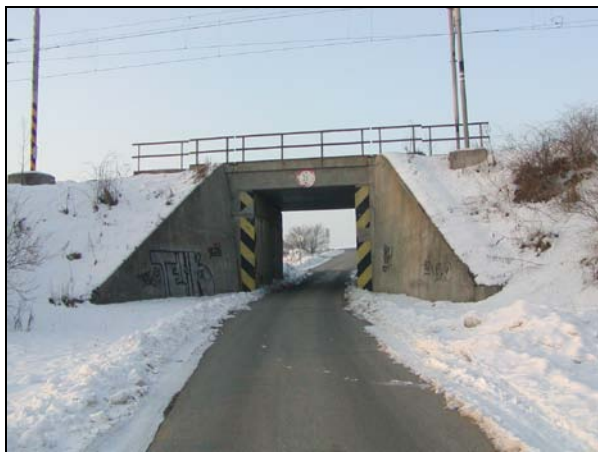
Pohled na most zleva – ve směru od Slavíkovice