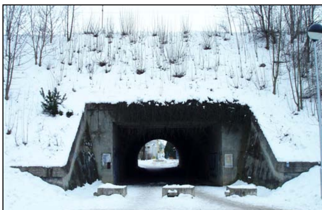
Most v km 47,436 – pohled zleva