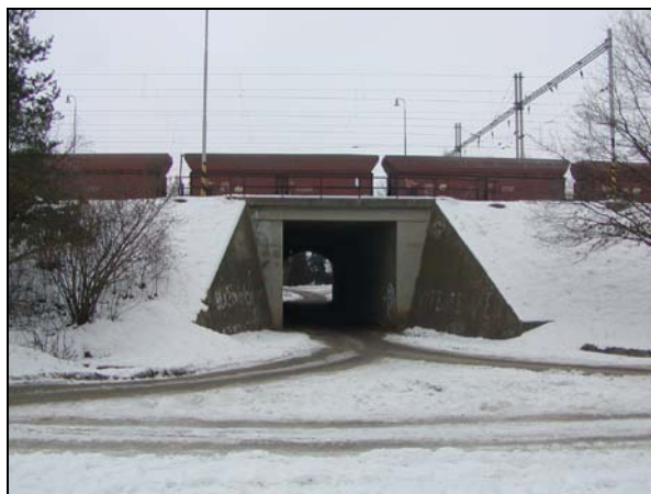
Pohled na most zprava

Most o 1 otvoru, celkem pro 9 kolejí, přes místní komunikaci. Trať v přechodnici z levého oblouku do přímé.