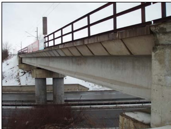
Most v km 49,394 – pohled zprava proti km