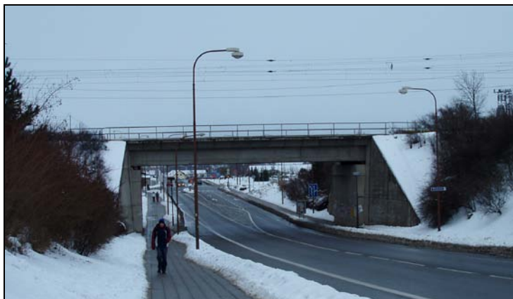
Most v km 46,497 – pohled zleva