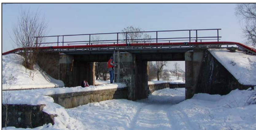
Most v km 77,699

Most o dvou otvorech s jednou kolejí přes potok Svodnici a polní cestu. Objekt převádí jednu kolej v širé trati. Ocelová mostní konstrukce svařovaná s plnostěnnými nosníky, bez mostovky, kolmá. Spodní stavba betonová, úložné kvádry konstrukcí kamenné. Betonová křídla u brněnské opěry jsou svahová, šikmá a u přerovské rovnoběžná. Kolej v přímé.