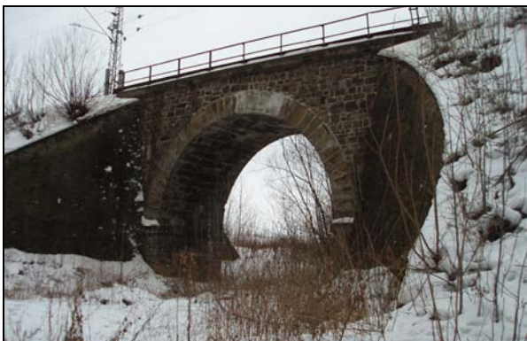
Most v km 49,482 – pohled zprava