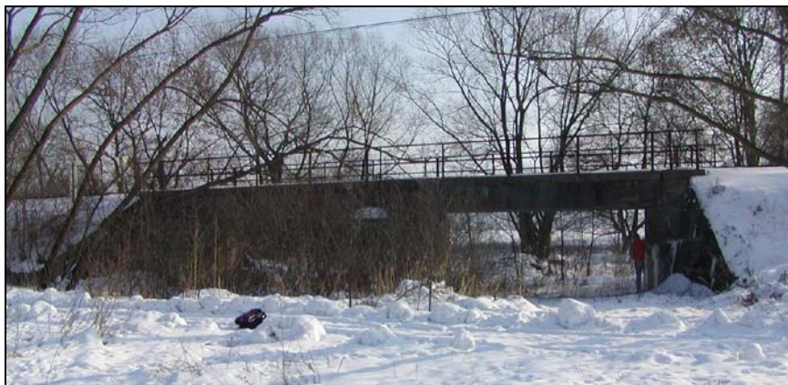
Most v km 75,614