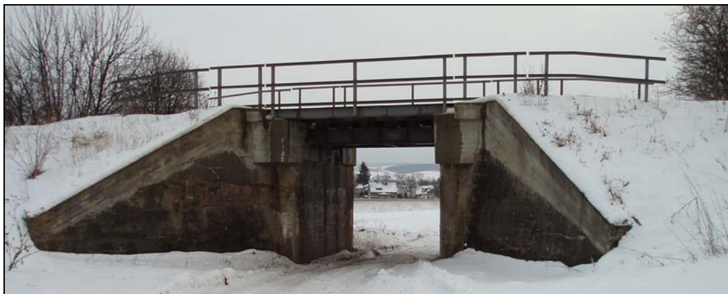
Most v km 52,996 – pohled zleva