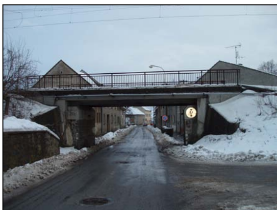
Most v km 55,810 – pohled zleva

M1, M2 – Trať vedena mimo mostní objekt, možné zrušení bez náhrady.