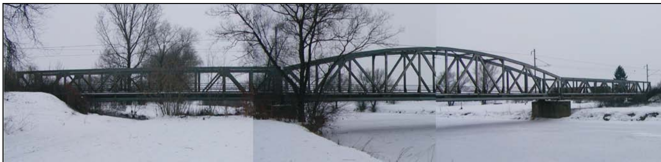
Most v km 74,798