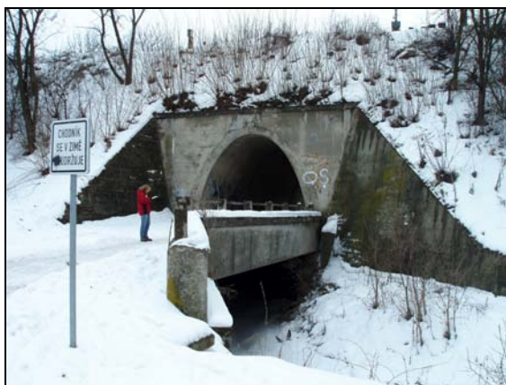
Most v km 46,056 – pohled zprava

Most o jednom otvoru přes chodník pro pěší a vodní tok Drnůvka. Objekt je v širé trati, převádí jednu kolej. Kolej na mostě v přímé s průběžným kolejovým ložem. Nosnou konstrukci tvoří betonová klenba vejčitého tvaru. Konstrukce mají kolmé ukončení. Spodní stavba mostu je betonová. Křídla betonová šikmá svahová vlevo i vpravo trati.