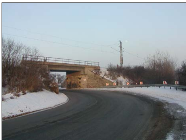
Pohled na most zleva