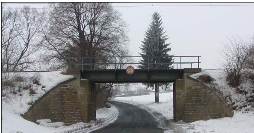
Most v km 65,582