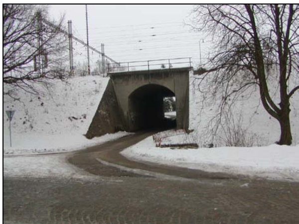
Pohled na most zleva – vlevo žst. Blažovice

BP, O2+, M1, M2, N1, N2, K3 - V PD bude proveden přepočet, sanace spáry, nové zábradlí.