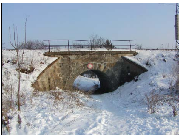
Pohled na most zprava