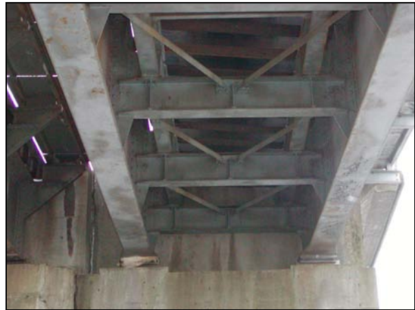
Pohled OK v levé koleji – směrem na brněnskou opěru