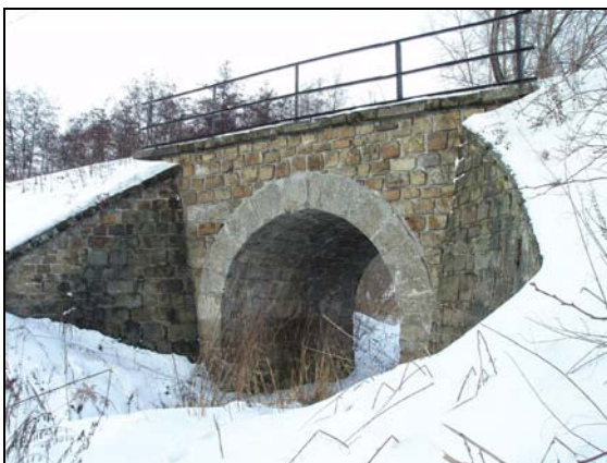
Most v km 42,631 – pohled zprava