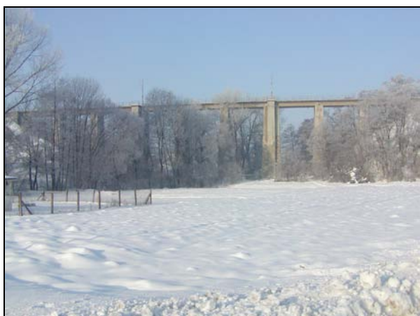
Pohled na viadukt zprava (od silnice)