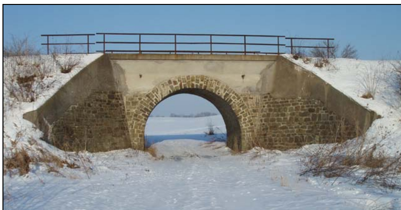
Most v km 59,776 – pohled zprava