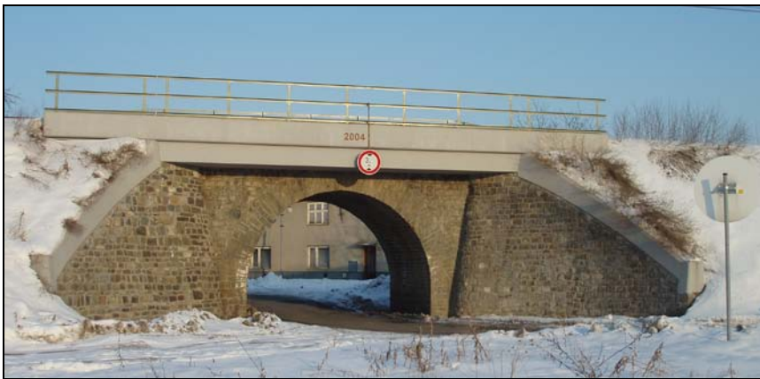
Most v km 63,501 – pohled zprava

M1, M2, K3 – Vzhledem k posunu koleje se navrhuje nový most pro dvě koleje o jednom otvoru přes vodoteč Brodečka a účelovou komunikaci světlosti 11,0 m. Kolej je ve směrovém oblouku. Nosná konstrukce je předpokládána jako železobetonová deska z tuhou výztuží ze zabetonovaných nosníků, opěry z prostého betonu, úložné prahy železobetonové, křídla šikmá svahová, z prostého betonu.