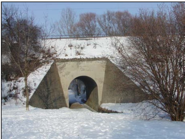
Pohled na most zprava, u přerovské opěry koryto potoka