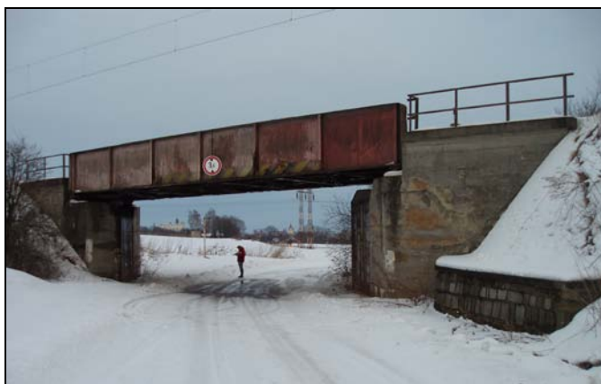
Most v km 54,298 – pohled zleva