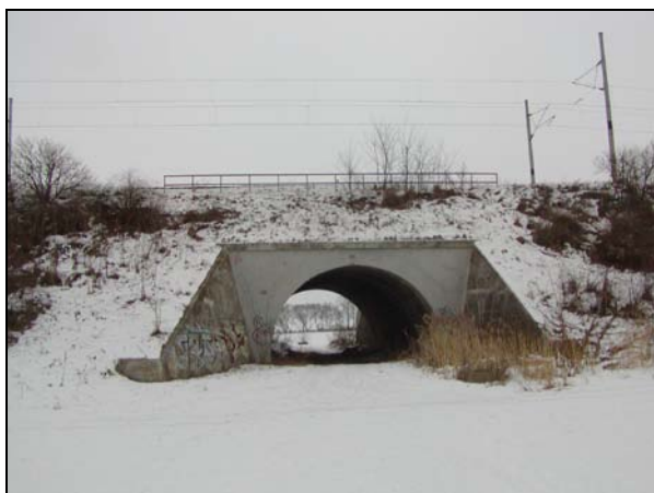
Pohled na most zprava