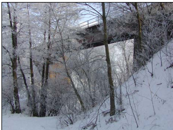
Pohled na most zleva trati