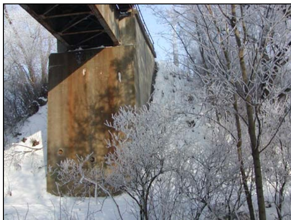
Pohled na přerovskou opěru