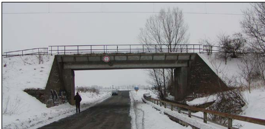
Most v km 67,840