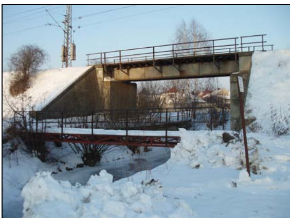
Most v km 63,432 – pohled zprava