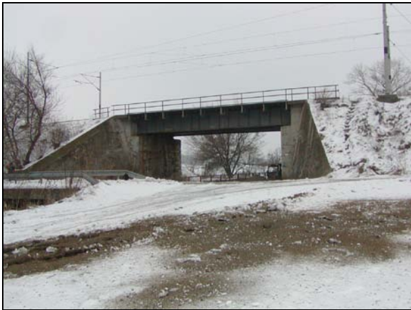
Pohled na most zprava, pod mostem koryto potoka, cesta