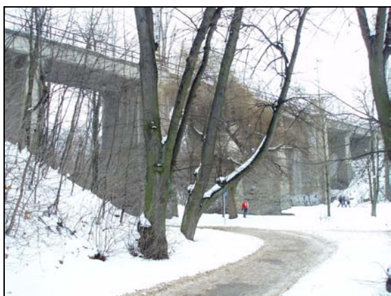
Most v km 47,342 – pohled zprava