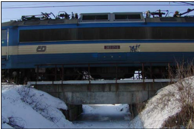
Most v km 83,420