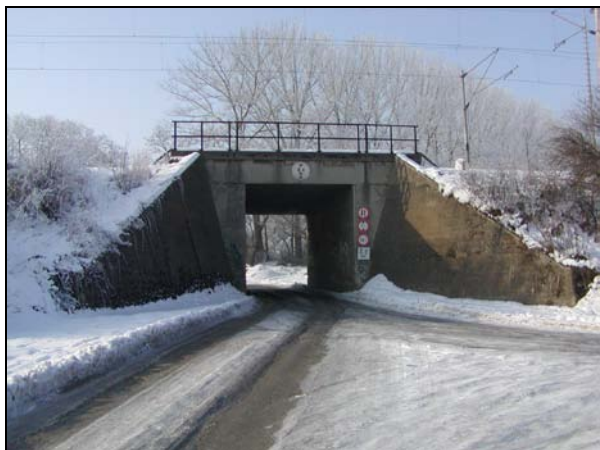
Pohled na most zprava, vpravo žst. Komořany u Vyškova

Most o 1 otvoru, pro 2 koleje, most přes silnici. Trať v oblouku vlevo.